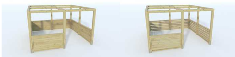
Panel poziom 1