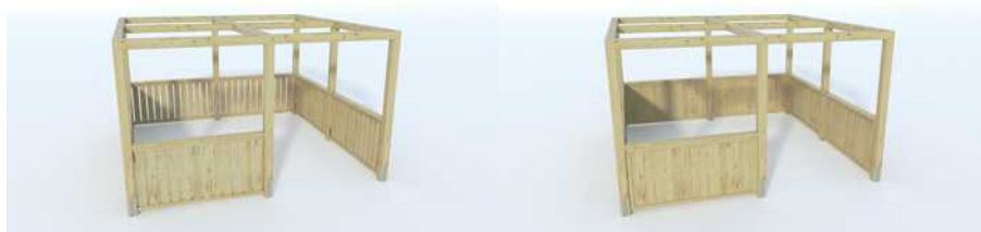
Panel pion 1