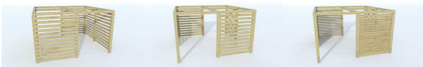
Ściana Ażurowa prosta 1