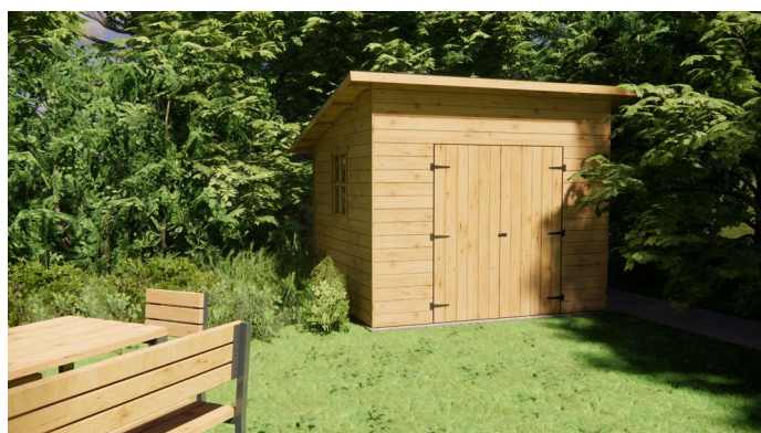
Domek ModuLor z dachem jednospadowym