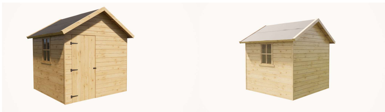
Domek ModuLor z dachem dwuspadowym